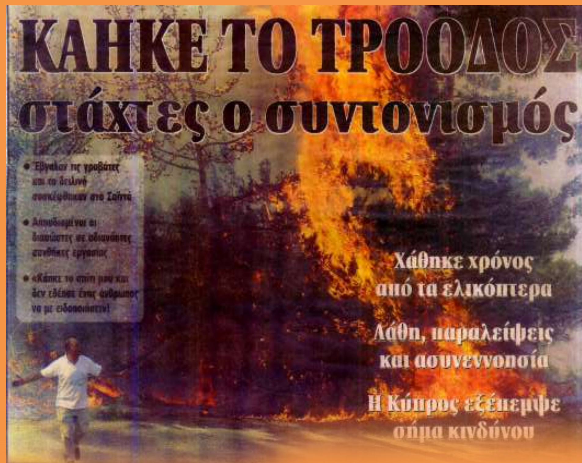
Τα πύρινα μέτωπα