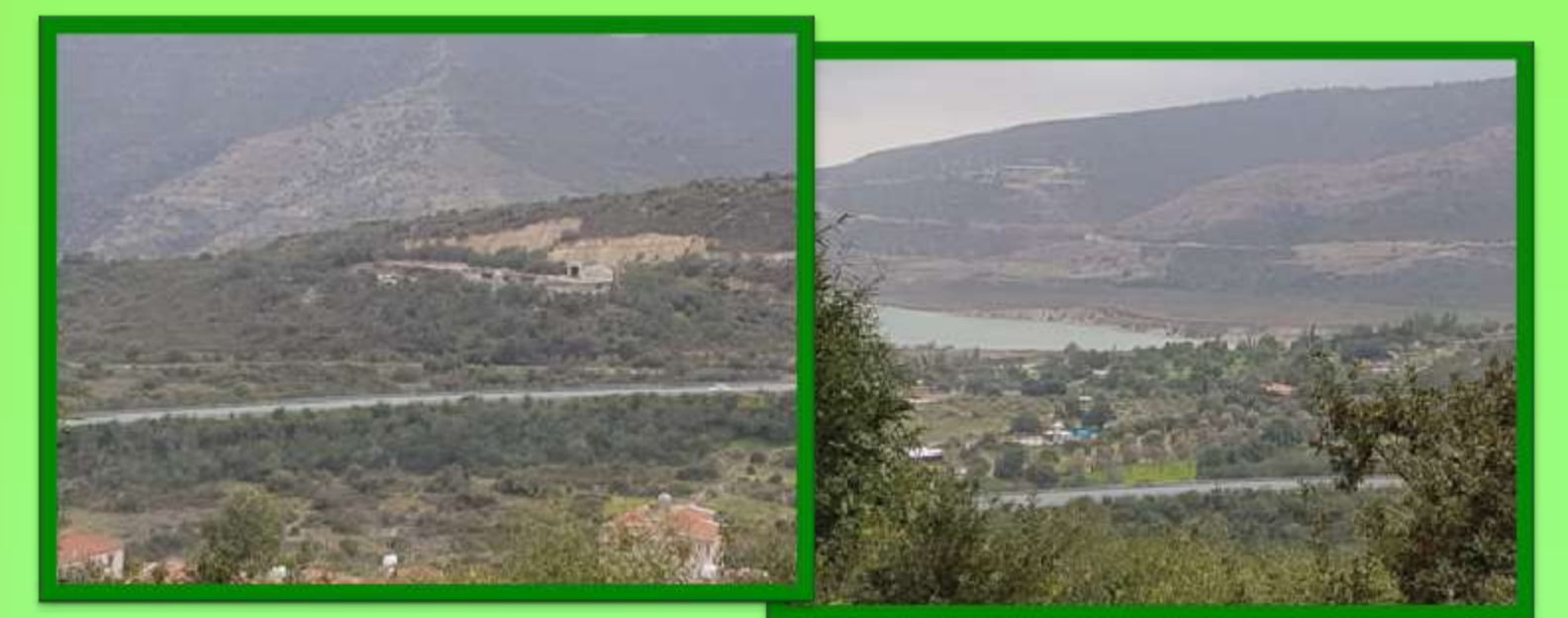
Ολική καταστροφή του πρασίνου γύρω από το χωριό Άλασσα(2002)