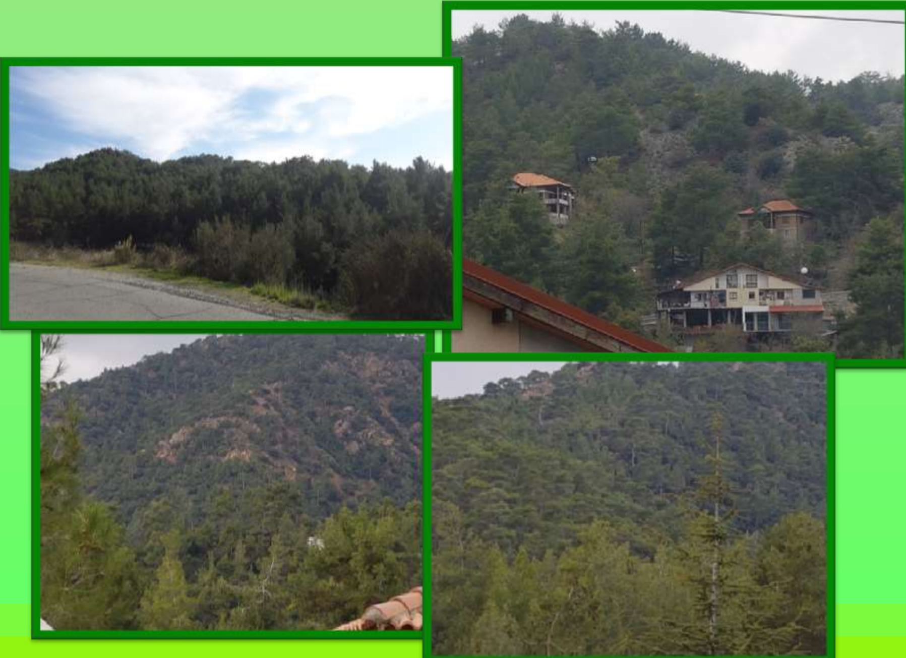
Το χωριό Πελέντρι κρυμμένο μέσα στο πράσινο!!!