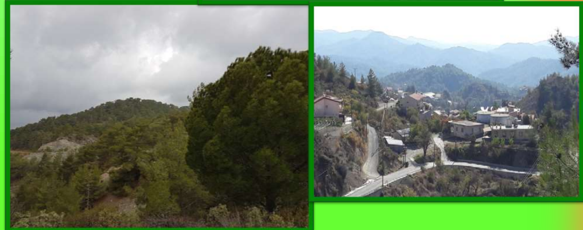
Το θαύμα της φύσης!!!