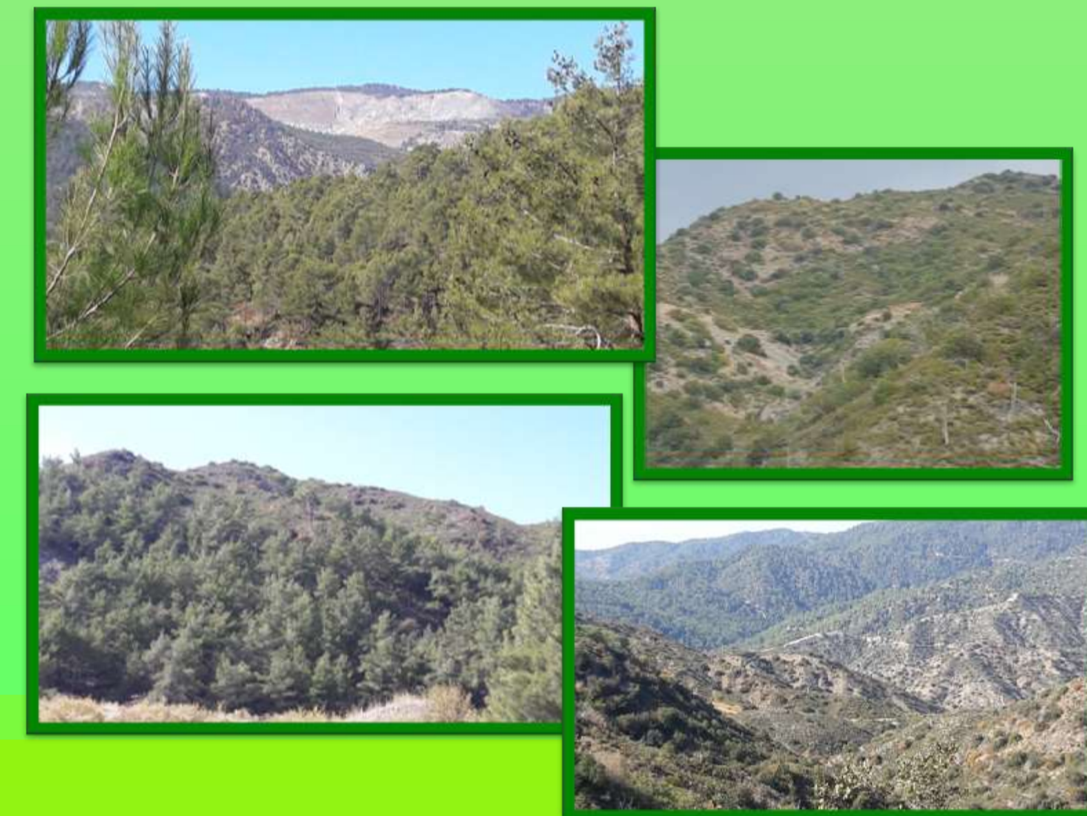
Το αποτέλεσμα της καταστροφικής πυρκαγιάς στο Πελέντρι(2007)