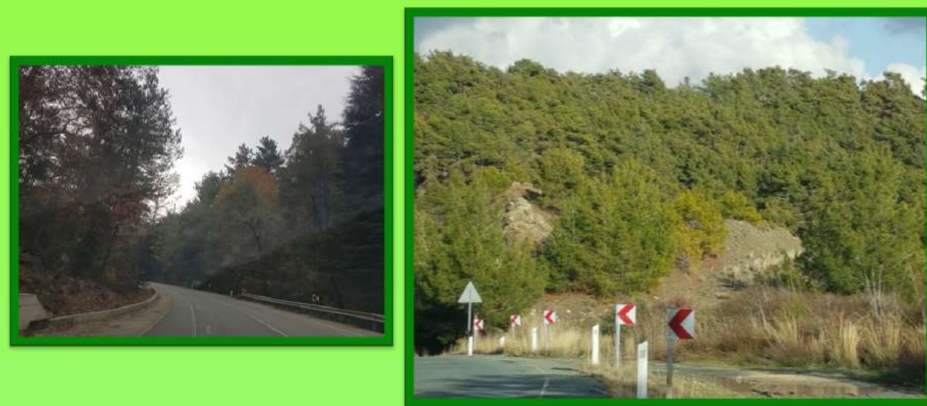
Η καταπράσινη διαδρομή από Σαϊπτά προς Πελέντρι