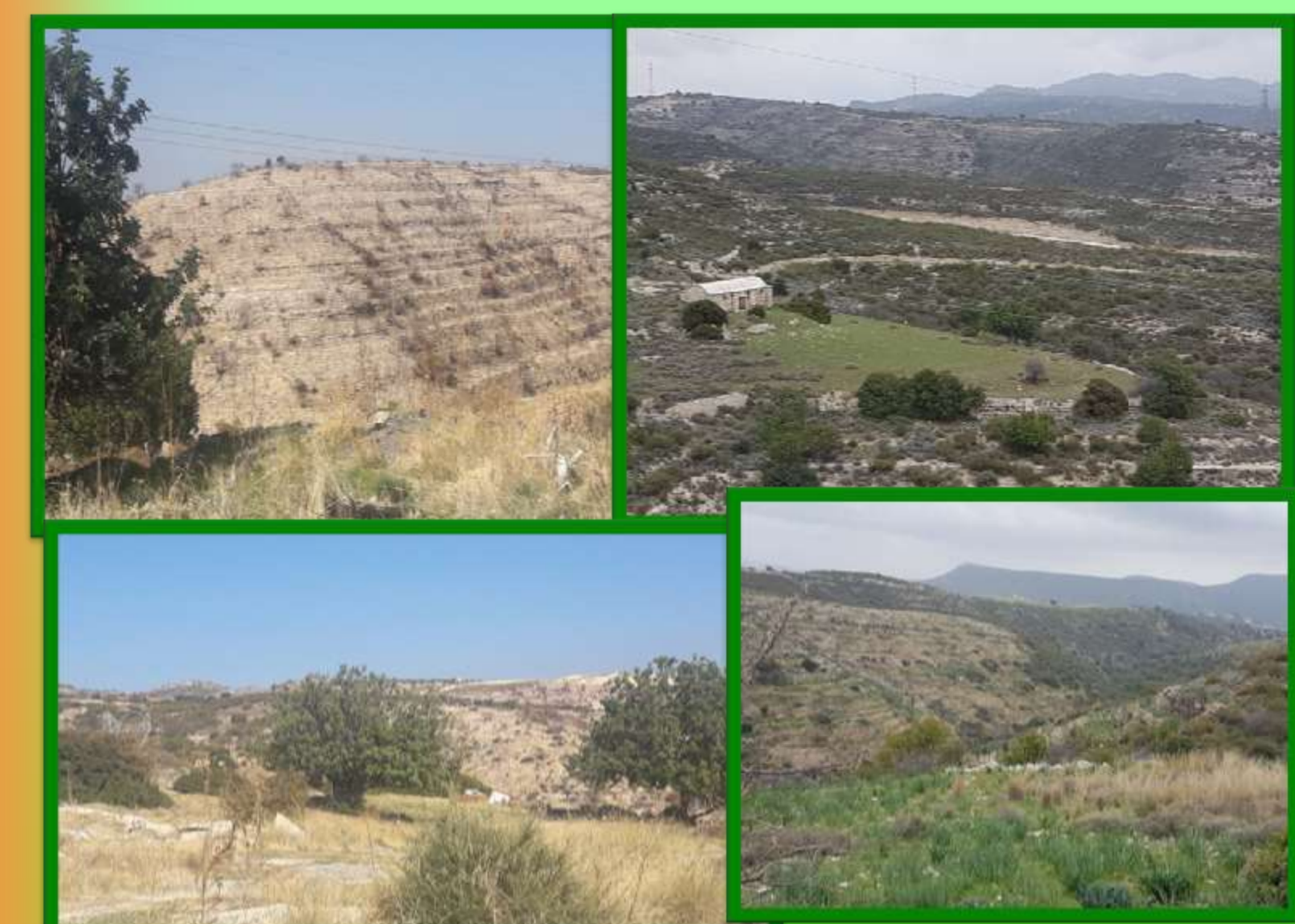
Το πράσινο της Άλασσας, έγινε παρανάλωμα του πυρός (2018)