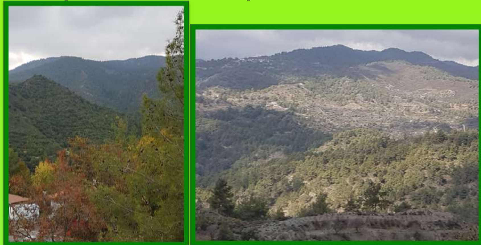
Η φυσική ομορφιά πριν το χάος!!!