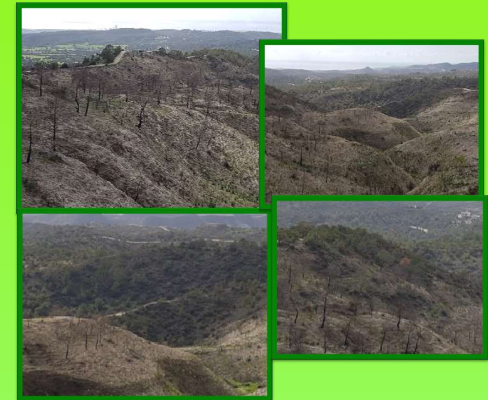
Η καταστροφική πυρκαγιά στο χωριό Χοιροκοιτία(2018)